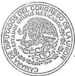
Dip. Sergio Carlos Gutiérrez Luna Presidente

SALÓN DE SESIONES DE LA CÁMARA DE DIPUTADOS DEL HONORABLE CONGRESO DE LA UNIÓN.- Ciudad de México, a 05 de noviembre de 2024.